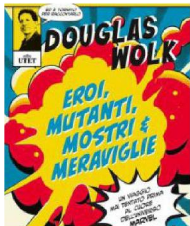
Concentrato La copertina del libro/mix