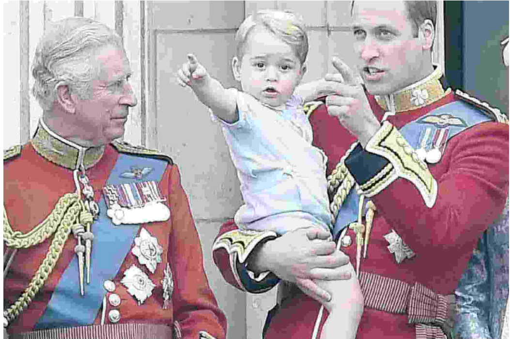
Re Carlo III, 74 anni, al balcone di Buckingham Palace con il figlio William, 40, e il nipote George, 9. Sotto, in lacrime al funerale della Regina

Carlo III: la dinastia attesa di un re UTET 300 pagine - 19 euro ★★★★