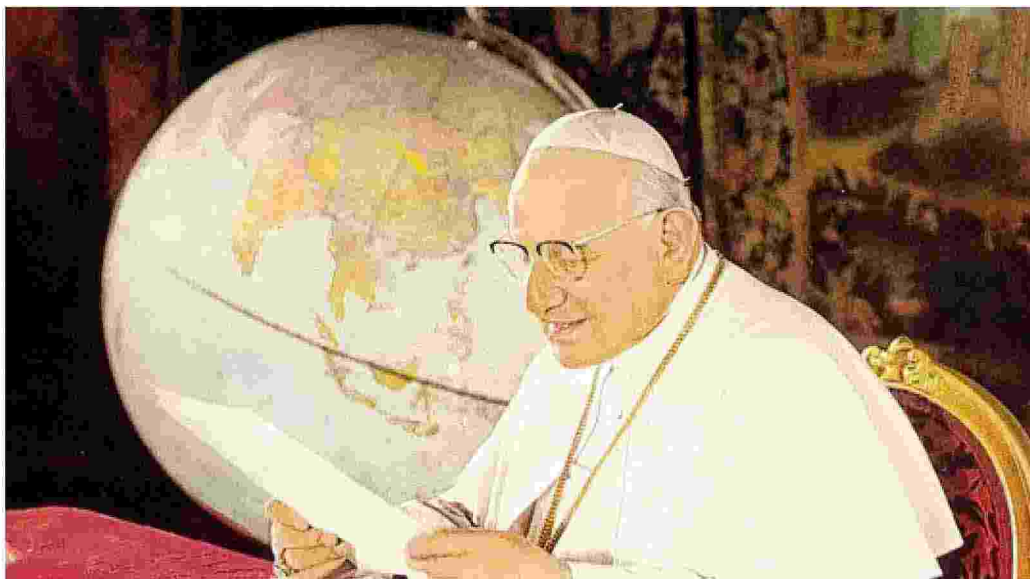
Papa Giovanni XXIII legge un radiomessaggio nella Sala del Mappamondo