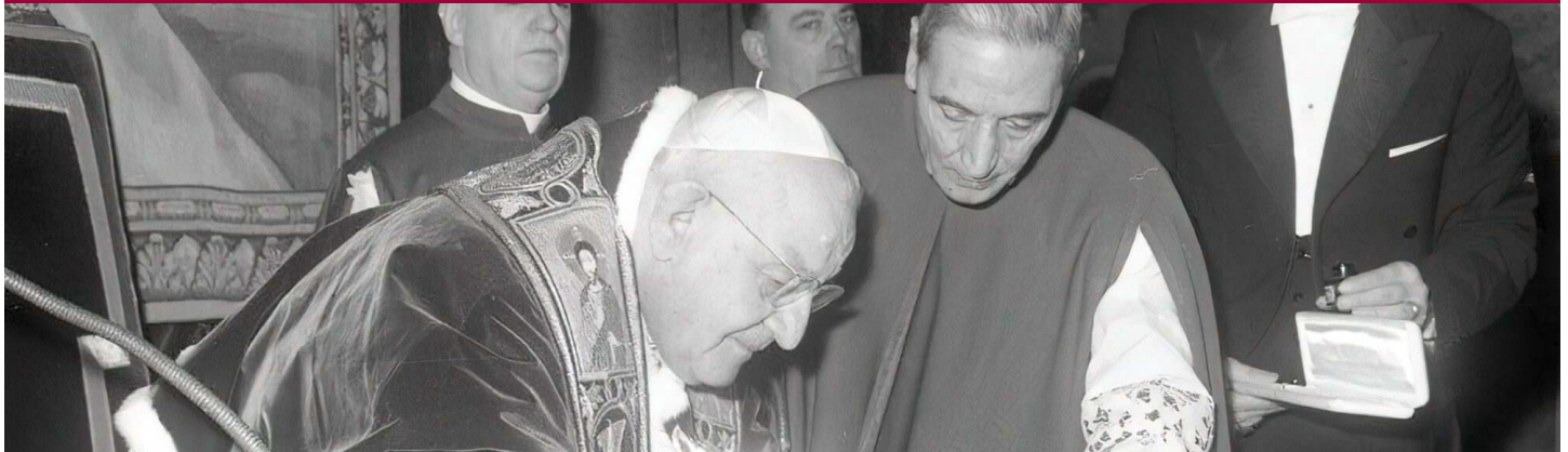
Giovanni XXIII firma bolla di indizione del Concilio Vaticano II