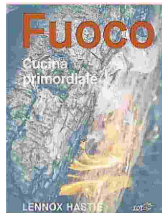
Fuoco. Cucina primordiale Lennox Hastie, Edt 256 pagine, 35 euro