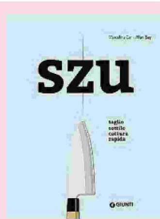
Szu. Taglio sottile cottura rapida Marcelina Car, Allan Bay, Giunti 216 pagine, 26 euro