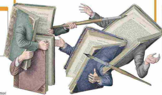
La sigla GL sta per Grandi Lettori

All'inizio del nostro torneo erano in gara ben 850 titoli, il meglio della narrativa italiana del 2021 Adesso siamo all'ultimo atto