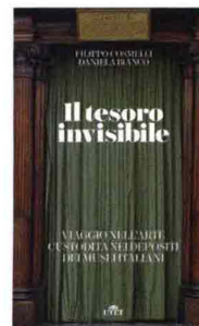
★ Il tesoro invisibile , di Filippo Cosmelli e Daniela Bianco, Utet 2021, 208 pagine, 22 €. Formato: 14x21,3 cm

Un viaggio in dodici tappe dietro le quinte dei musei italiani per saggiare il "giacimento" culturale invisibile su cui poggiano le fondamenta delle collezioni esposte. È la proposta di Filippo Cosmelli, storico dell'arte, e Daniela Bianco, architetta, che all'offerta di inedite ed esclusive esperienze di fruizione dei nostri beni culturali hanno dedicato l'impegno della loro If Experience. «I depositi sono luoghi onirici, sospesi in un'atmosfera di attesa quasi trascendentale» , scrivono. «Sono dei veri e propri musei al contrario, che testimoniano l'imperscrutabile ricchezza del nostro passato e della conoscenza umana. Quanto esposto in superficie non è che la punta dell'iceberg». Sotto questa linea di galleggiamento i lettori incontrano il racconto di luoghi e oggetti straordinari, come la lettera del 1530 inviata da Enrico VIII d'Inghilterra a papa Clemente VII che ha dato origine allo scisma anglicano, conservata nell'Archivio Apostolico Vaticano, oppure i Tarocchi Sola-Busca , prezioso mazzo del XV secolo custodito a Milano nella Pinacoteca di Brera.