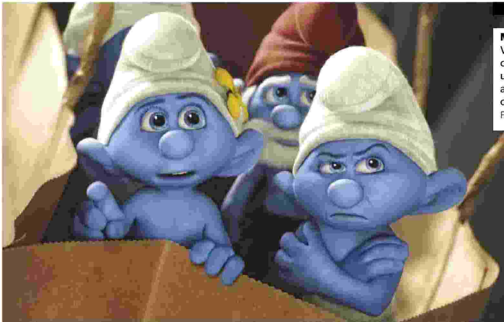
Massoni Vedono nel cappuccio bianco un rimando al Ku Klux Klan o alla massoneria