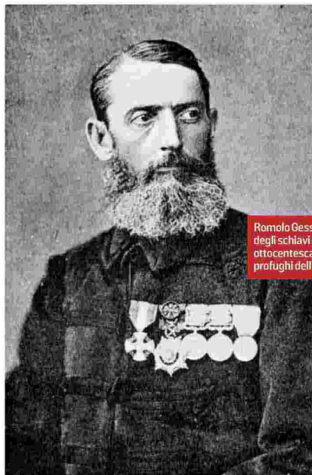
Romolo Gessi (1831-1881). Sopra, la tratta degli schiavi in Africa in una stampa ottocentesca. Sotto, donne in un campo profughi dell'Unicef nel Sud Sudan