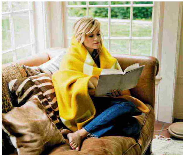
L'attrice Reese Witherspoon ha un seguitissimo book club. Su @reesesbookclub ogni mese un libro che ha al centro la storia di una donna.