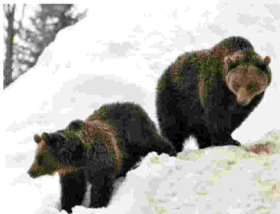
Gli orsi non solo tra la neve ma anche tra le villette in Abruzzo

I gatti selvatici continuano a rimanere misteriosi, ci sono, ma nessuno li vede, qual-