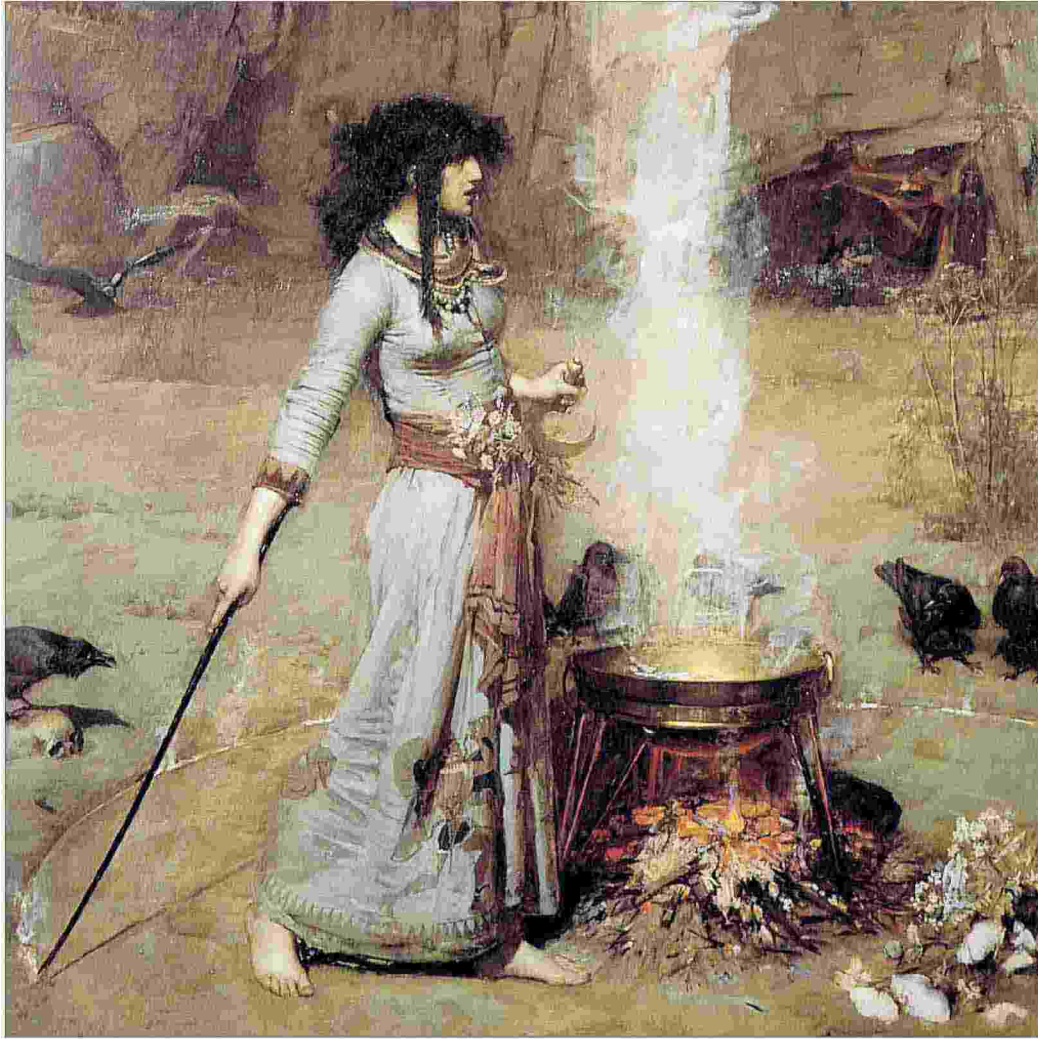
John William Waterhouse, "The Magic Circle", 1886 (Wikipedia)

Un paese e una comunità rinata dopo l'epidemia sterminatrice di un secolo prima, della cui rinascita si è autoproclamata custode una donna