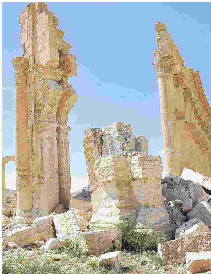
Palmira, uno dei siti di grandissimo interesse culturale presi di mira dall’Isis