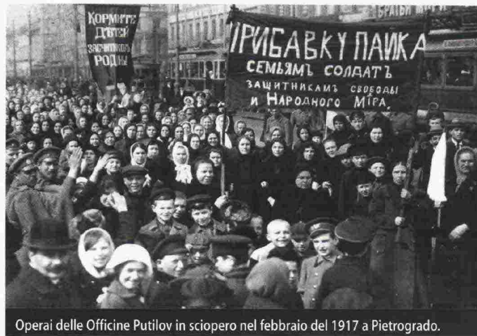
Operai delle Officine Putilov in sciopero nel febbraio del 1917 a Pietrogrado.

sovietica, dalla sua nascita al suo trionfo sul nazismo. Una ricostruzione nuova di un evento che ha affascinato e impaurito il XX secolo con i suoi conflitti sociali, la sua ideologia e le dittature, diverse ma affini, di Lenin e Stalin. Graziosi parla di "esperimento" sovietico, raccontando al contempo anche l'influenza e l'inevitabile potere di attrazione che l'ultima grande utopia nata in Occidente ha esercitato per molto tempo sul mondo intero.