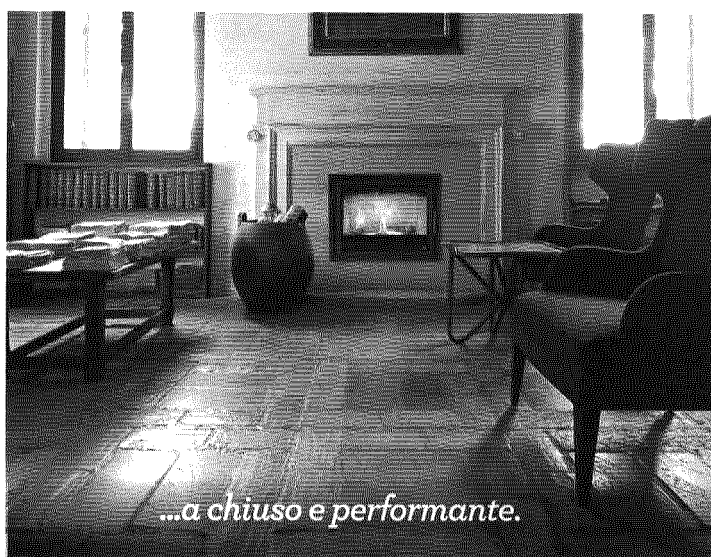
...a chiuso e performante.