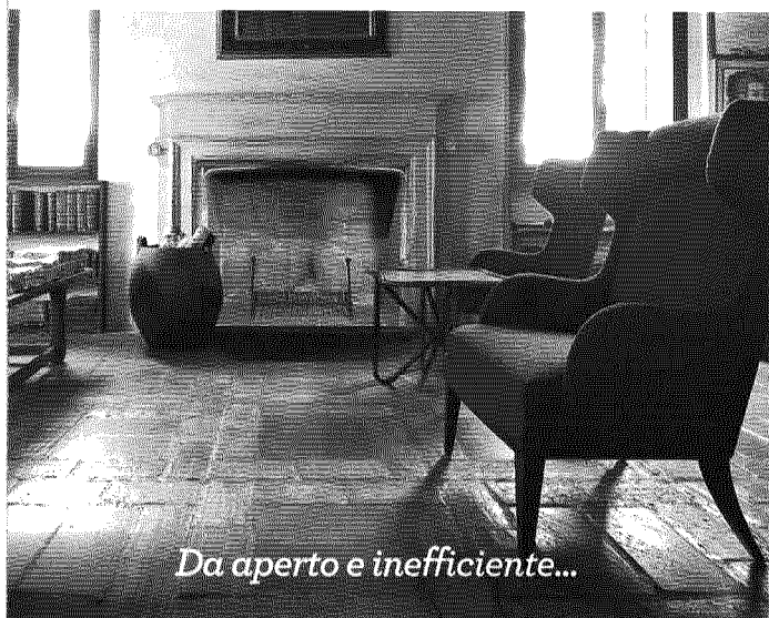
Da aperto e inefficiente...