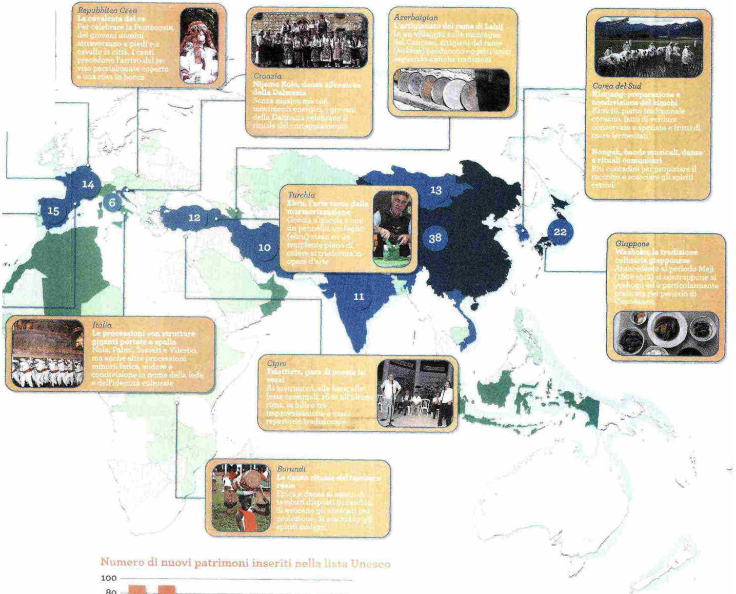
Numero di nuovi patrimoni inseriti nella lista Unesco