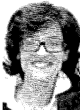
Il personale «Nella mia famiglia cattolica

Nel suo ultimo saggio Papà, mamma e gender (Utet, pagg. 190, euro 12) la filosofa (che oggi sarà ad Avellino, alla Biblioteca provinciale) e domani a Casal di Principe (alle 10.30 all'Università per la Legalità) e a Pomigliano d'Arco (alle 17 alla Biblioteca Comunale), cerca di fare chiarezza su un argomento che sta suscitando paure destinate a mobilitare schiere di opinionisti e moralisti a pronunciarsi sul fatto se sia giusto o meno che nelle scuole si parli di identità di genere. Uomini e donne, si nasce o si diventa? E che cos'è la teoria del gender? Lo chiediamo alla Marzano che insegna a Parigi ed è deputata nelle file del Pd.