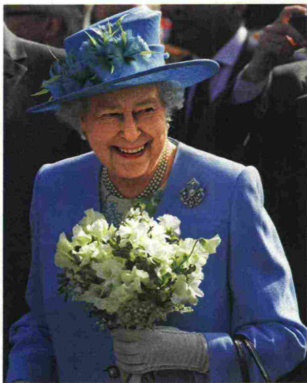
IN FIORE DA 90 ANNI Elisabetta II, 90 anni il 21 aprile, in uno dei suoi famosi tailleur pastello . In mano un bouquet bianco: seppure non appassionata di giardinaggio come la madre, ama molto i fiori.