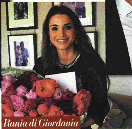
Rania di Giordania

LA REGINA SA DI MUSCHIO «Non la conosco di persona, ma usa la mia fragranza Bellatrix, con le note dominanti di muschio e fava tonka», dice Bosetti Tonatto della regina Rania di Giordania, 45.