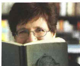
di Nicoletta Sipos