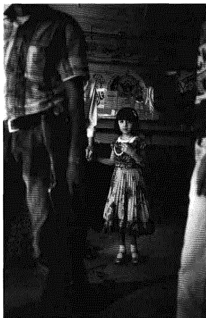
▲ Alessio Romenzi, Siria 2011

info@mediterraneofotografia.eu www.mediterraneofotografia.eu www.photofestival.it