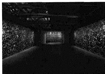
▲ Rashid Rana Series _Installation View at Pier 24

La Gujral Foundation e la Fondazione Antonio Mazzotta aprono al pubblico la mostra My East is your West, evento che unisce per la prima volta India e Pakistan. Nata dal desiderio di reindirizzare il complesso clima di rapporti storici tra gli stati-nazione dell'Asia del Sud, la mostra li presenterà come due Paesi che condividono la stessa cartografia culturale. Il pensiero di come il mondo sarebbe stato diverso se India e Pakistan non fossero stati definiti dai loro confini rimane latente, ma è sempre presente. In considerazione delle loro abitudini, Gupta e Rana sono stati invitati a creare una presentazione unica in cui una serie di lavori esprimerà l'intera essenza di un popolo diviso, di una storia che abbraccia antichità, modernità coloniale e un presente cosmopolita, aspetti intrappolati in una situazione conflittuale. Questo viaggio verso il concepimento di una piattaforma condivisa è costruito sull'interesse degli