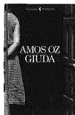
Giuda , di Amos Oz, Feltrinelli 2014, 329 pagine, 18 euro.

In una Gerusalemme invernale, a cavallo tra il 1959 e il 1960, Shemuel Asch interrompe gli studi universitari e si procura uno strano lavoretto: in cambio di vitto, alloggio e un modesto stipendio farà compagnia a un anziano disabile che vive insieme a una quarantacinquenne, enigmatica e attraente. Shemuel, che non ha ancora superato il recente abbandono della sua ex fidanzata, si sente tradito e proprio attorno al tradimento Amos Oz costruisce questo romanzo, in cui semina da subito dubbi e domande: sulla misteriosa donna, sulla figura di Gesù, su Giuda, il traditore per eccellenza. Nell'Israele di Ben Gurion, Oz si chiede se il tradimento non abbia in sé una sua intrinseca necessità: solo tradendo le convenzioni si può cambiare il mondo.