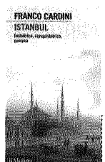
Istanbul , di Franco Cardini, Il Mulino 2014, 316 pagine, 16 euro.

Istanbul ha sedotto Franco Cardini, storico, saggista, docente universitario, esperto di Medioevo e dintorni. Questa sua ultima fatica letteraria è da subito un invito al viaggio e alla lettura. L'uno senza l'altra ha poco senso in genere, ma ne ha ancor meno nel caso di una città così complessa e ricca di avvenimenti e di suggestioni come l'antica Bisanzio, la romana Costantinopoli, la moderna e contemporanea Istanbul. Cardini prima ne racconta la storia, l'arte, le fedi, i simboli e poi, nell'ultimo capitolo, prende letteralmente il lettore-viaggiatore per mano e lo conduce alla scoperta dei monumenti e degli scorci più seducenti.