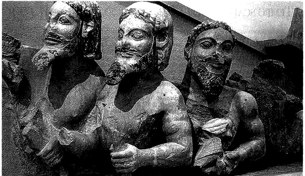
Scultura frontonale frammentaria detta «Barbablu», 560 a.C. circa, Atene, Museo dell'Acropoli

Alla lettura comparata dei due testi, balzano subito agli occhi le differenze. Omero fa del viaggio uno strumento per marcare il divario tra la civiltà greca e la barbarie degli altri popoli: Polifemo rappresenta una socialità pre-politica, priva di valori religiosi, dove mancano leggi e assemblee e dove è assente l'agricoltura; Circe e Calipso (entrambe dedite al canto e alla tessitura) incarnano modelli femminili negativi fondati sull'inganno, che nulla hanno a che vedere con le virtù greche della moglie, della madre e della sorella; i Lotofagi