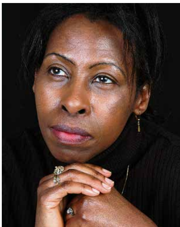
Scholastique Mukasonga è nata in Ruanda nel 1956.