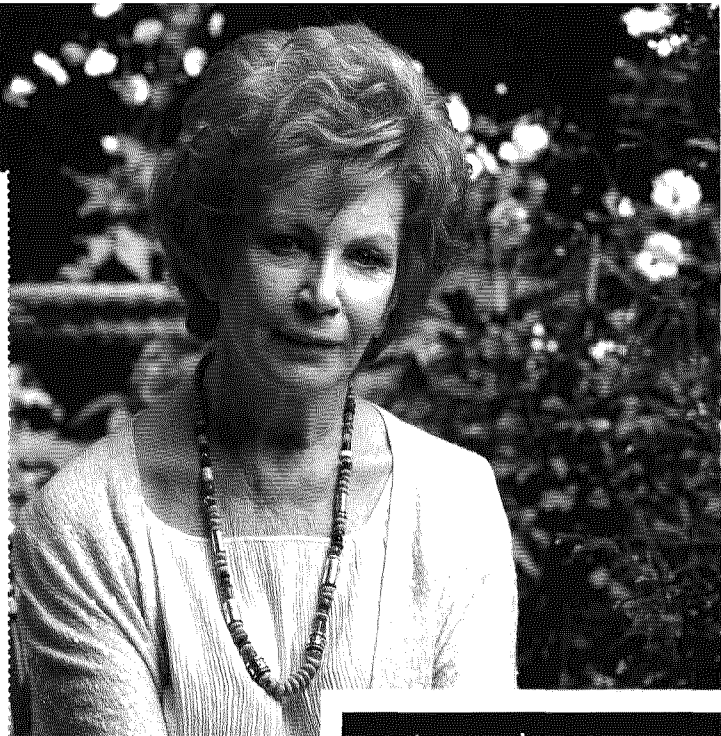
Edna O'Brien, 82 anni

ma sicuramente ci va vicino) per tracciare un profilo indimenticabile di un'epoca, di una terra, di una cultura. Certo, usa la propria esperienza personale di bambina e poi ragazza che da quei luoghi è fuggita, ma come lo fa! Con una lingua ricca, calda, piena di ritmo, unita a uno sguardo lucido, che taglia come un bisturi: l'odio per le ipocrisie e la mentalità bigotta prende forma, ma non soffoca la freschezza delle voci giovani che raccontano. Quanto Cait, la narratrice, è ingenua e naïf, tanto Baba è feroce e scaltra; una ha paura di tutto, l'altra di nulla, eppure sono unite a doppio filo dallo spirito di libertà, di ribellione verso un mondo che le soffoca, attratte dal nuovo bisogno femminile di vivere l'amore e la sessualità senza vincoli. Arrivate nella grande città, Dublino, sono pronte a bruciare in fretta le