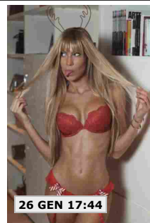
26 GEN 17:44