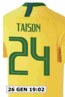
26 GEN 19:02