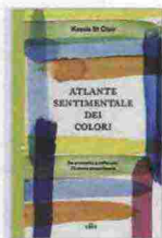
L'ATLANTE DEI COLORI