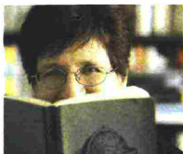
di Nicoletta Sipos