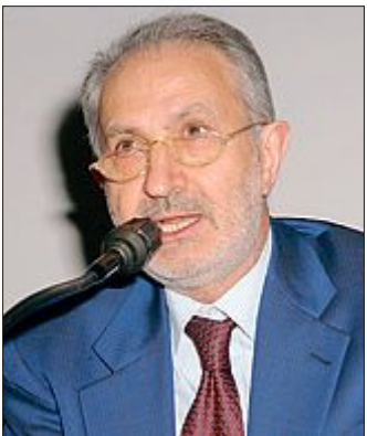
Giovanni Caprara ha seguito le missioni marziane al JPL della Nasa a Pasadena e all'IKI di Mosca.

scienze necessarie per una futura missione verso il "pianeta rosso". Fra i soci più illustri, ricorda Caprara, figura Edwin Aldrin, il secondo uomo a mettere piede sulla luna nel luglio del 1969, «diventato acceso sostenitore con libri e conferenze della necessità di affrontare la spedizione verso il vicino pianeta, futura casa dell'uomo». Nel 2005 a Curno, in provincia di Bergamo, fu costituita anche una sezione italiana della Mars Society presieduta da Antonio Del Mastro. Si sta lavorando, dunque, per conquistare Marte e per trasformarlo in una sorta di "succursale" della terra. E questa trasformazione si rende quanto mai necessaria perché la temperatura media del "pianeta rosso" è di -53°C. Ma in attesa di questo futuro marziano accontentiamoci dei tepori della nostra terra.