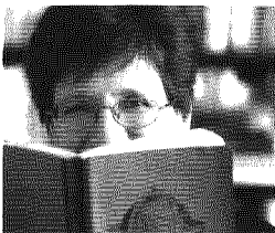
di Nicoletta Sipos