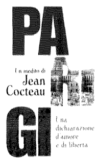
Jean Cocteau Parigi Piemme, 14,00 €

Si presenta così, come un volume innocente, questo inedito per l'Italia del grande poeta e drammaturgo francese. Ma quanta bellezza, quanta poesia nelle sue poche pagine. Un giorno, niente di meno che Marcel Proust, scrisse a J.Cocteau: «Credo di gelosia nel vedere come nei suoi straordinari pezzi su Parigi lei sappia evocare cose che io ho sentito e che son riuscito a esprimere solo