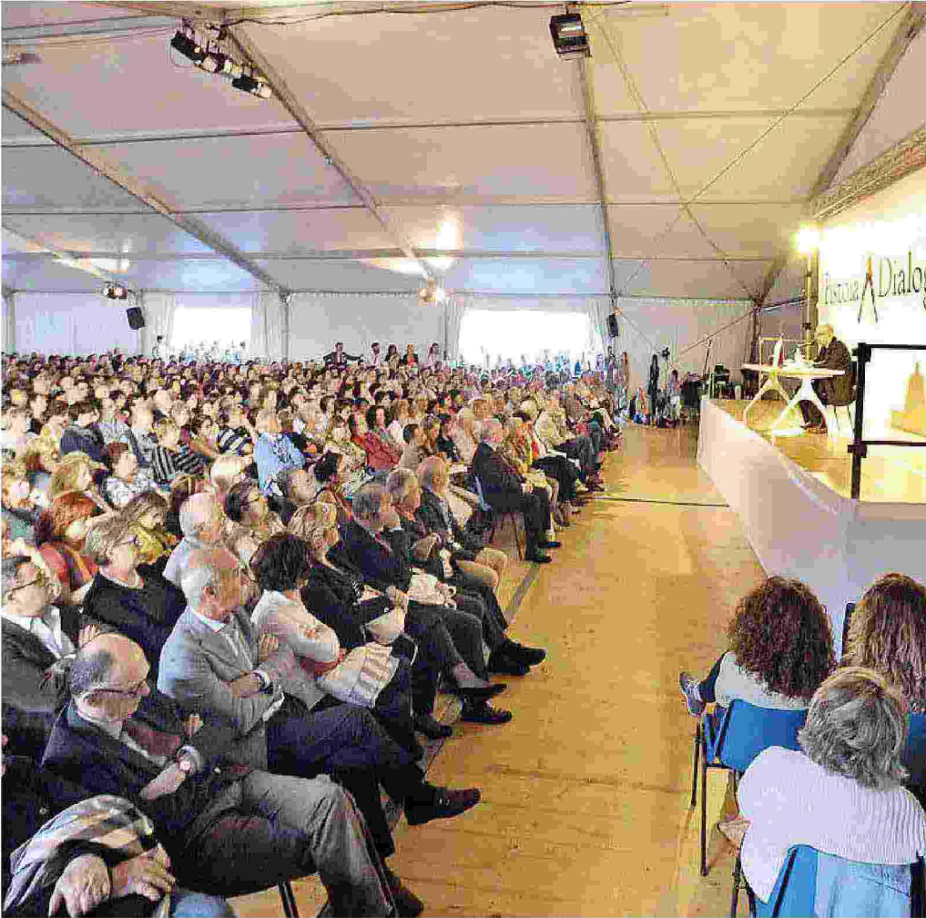
Una delle affollatissime iniziative dell'edizione dello scorso anno dei "Dialoghi sull'uomo"