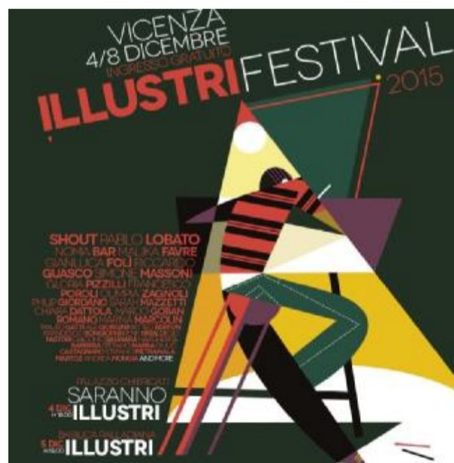
Il manifesto del Festival Illustri è stato disegnato da Pablo Lobato

Shout, Alessandro Gottardo, per una personale in Basilica; rivede la francese Malika Favre, attende la star di origine israeliana Noma Bar; riserva una sala al ricordo del vicentinissimo artista Toni Vedù, scomparso pochi mesi fa. Grazie alle sinergie e alla Fondazione Adone e Rina Maltauro, si è tessuta una rete di eventi che coinvolgeranno le scuole superiori in un incontro loro dedicato e i professionisti del settore in sei talk loro dedicati. In tutto, riassume Giorgini, 50 illustratori presenti, 9 mostre, 5 location. Il festival vero e proprio durerà dal 4 all'8 dicembre, con fiumi di giovani appassionati che sciameranno