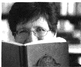
di Nicoletta Sipos